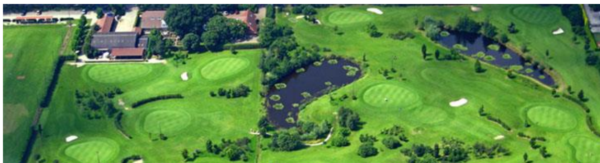
De oorspronkelijke 9-holes par 3 baan met linksboven het oude clubhuis en geheel links de oude driving range.

Wij wensen u veel spelplezier op Golfbaan het Woold.